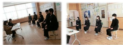
校長先生が面接官に